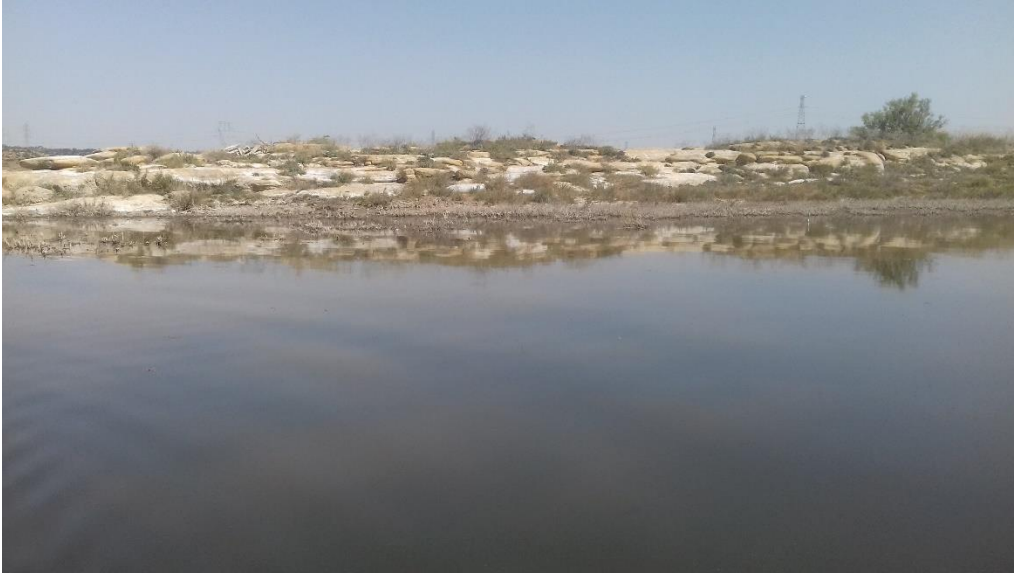
Vista general del lago