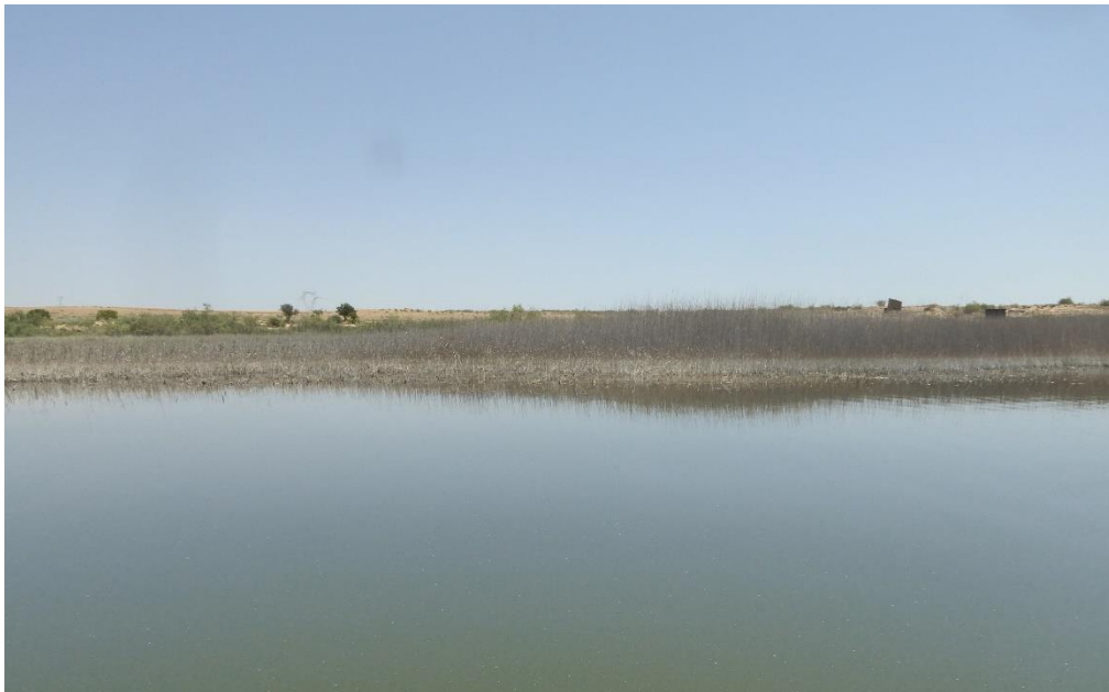
Vista general del lago